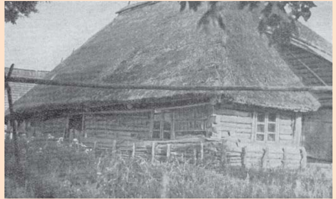
2 pav. Trobos vaizdas iš kairiojo galo

Ilustracijos iš leidinio „Gimtasai kraštas“ (1940 m., Nr. 1(24), p. 44–48)